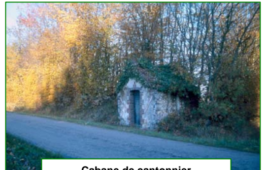
Cabane de cantonnier