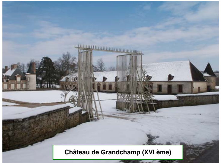
Château de Grandchamp (XVI ème)