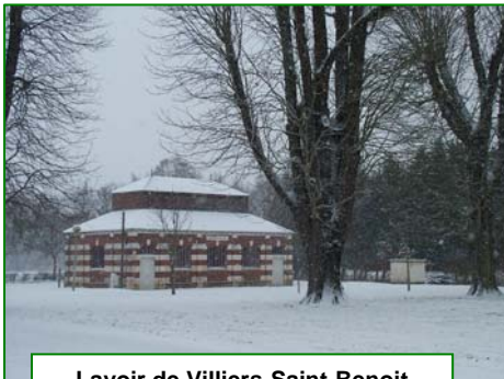
Lavoir de Villiers-Saint-Benoit