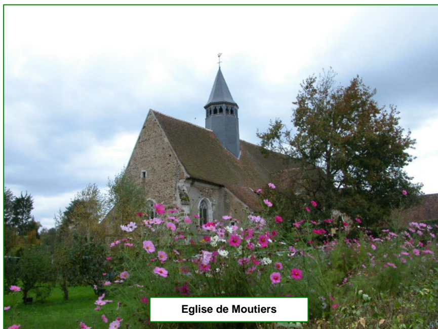
Eglise de Moutiers