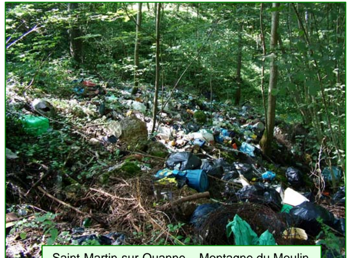
Saint-Martin-sur-Ouanne – Montagne du Moulin

Il est utile de faire un inventaire de ces sites