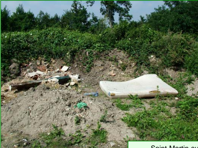
Saint-Martin-sur-Ouanne : les Tailles Maillards

Cependant , il existe ça et là des dépôts d'ordures disgracieux disséminés dans la région.